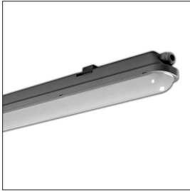
!תמונה להמחשה בלבד!