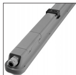
איור מס' 2

הפנסים הנ"ל מוגדרים כפסולת של ציוד אלקטרוני וחשמלי (WEEE). אי לכך אין להשליכם כפסולת רגילה. כאשר גוף התאורה מפסיק לפעול ולא ניתן עוד לתיקון, יש להטמינו במיכלים המיועדים לפסולת מסוג זה.