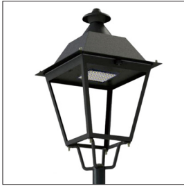
התמונה להמחשה בלבד!